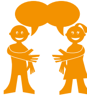
Libertad para Expresarse