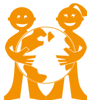
Cuidemos el Medio Ambiente