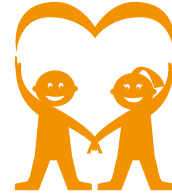
Cuidarse y Cuidarnos