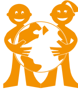
Cuidemos el Medio Ambiente

Se basa en cinco principios de convivencia: