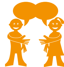
Libertad para Expresarse