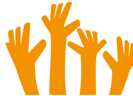
Toda Participación Vale