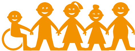
Igualdad e Inclusión

Allí se presentan los principios de convivencia: